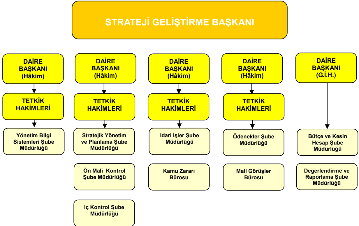
Tablo 1: Strateji Geliştirme Başkanlığı Organizasyon Şeması